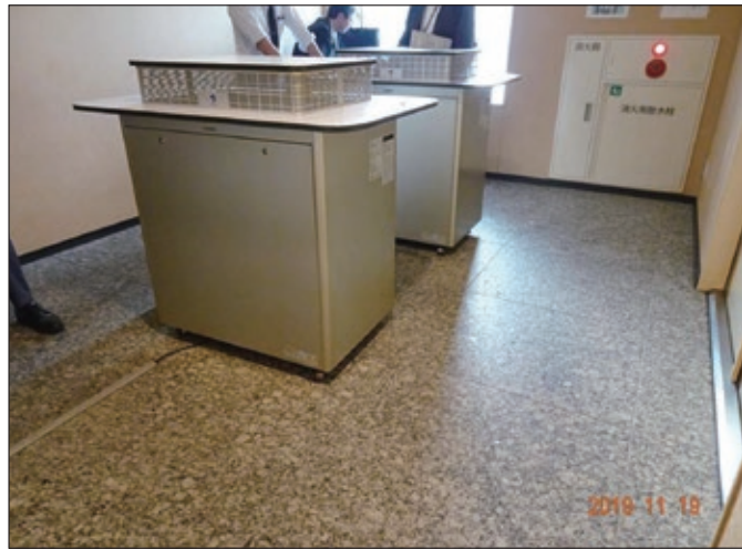
図6. 参議院会館、地下1階の喫煙室

そして、同じフロアにあるコンビニには葉巻を啜えた財務大臣(JTの筆頭株主)の似顔絵がパッケージに描かれた太いカリン糖、「タロ・カボネ」が売られていました(図8)。国会がこれでは…。