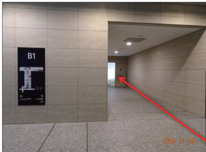
図7. 参議院会館、地下1階の奥まった喫煙室