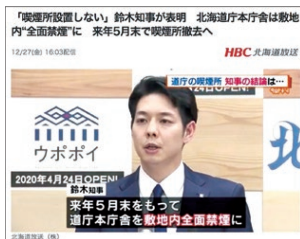
図3. 道庁の敷地内禁煙を発表する鈴木知事

清掃のために10～11時、14～15時の喫煙は禁止されておりますが、それ以外の時間は自由に喫煙できます。屋外の2カ所の喫煙室が撤去され、閉鎖式の喫煙室に集中するため、衣服に大量のヤニが付着します。屋外であってもすれ違うだけで喫煙してきたことが分かる程の強烈な臭い（三次喫煙）を発生させながらエレベーターに乗るので、「職員がタバコ臭い」という苦情が市民から寄せられ始めています。皆さんもぜひ市役所を訪問して実際に臭いを嗅いで、「エレベーターがタバコ臭い」という苦情を市の窓口へ投書して下さい。「寒い北海道庁で敷地内禁煙ができて、なぜ北九州市ではできないのか？北橋市長のリーダーシップに