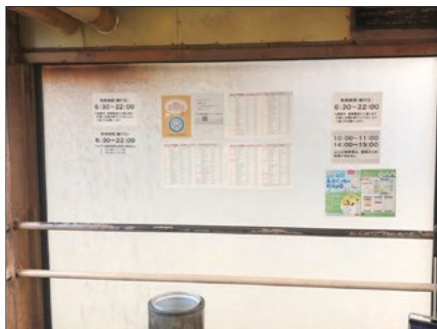
図5. 喫煙室ガラス面に貼られた半透明フィルム

清掃のために10～11時、14～15時の喫煙は禁止されておりますが、それ以外の時間は自由に喫煙できます。屋外の2カ所の喫煙室が撤去され、閉鎖式の喫煙室に集中するため、衣服に大量のヤニが付着します。屋外であってもすれ違うだけで喫煙してきたことが分かる程の強烈な臭い（三次喫煙）を発生させながらエレベーターに乗るので、「職員がタバコ臭い」という苦情が市民から寄せられ始めています。皆さんもぜひ市役所を訪問して実際に臭いを嗅いで、「エレベーターがタバコ臭い」という苦情を市の窓口へ投書して下さい。「寒い北海道庁で敷地内禁煙ができて、なぜ北九州市ではできないのか？北橋市長のリーダーシップに