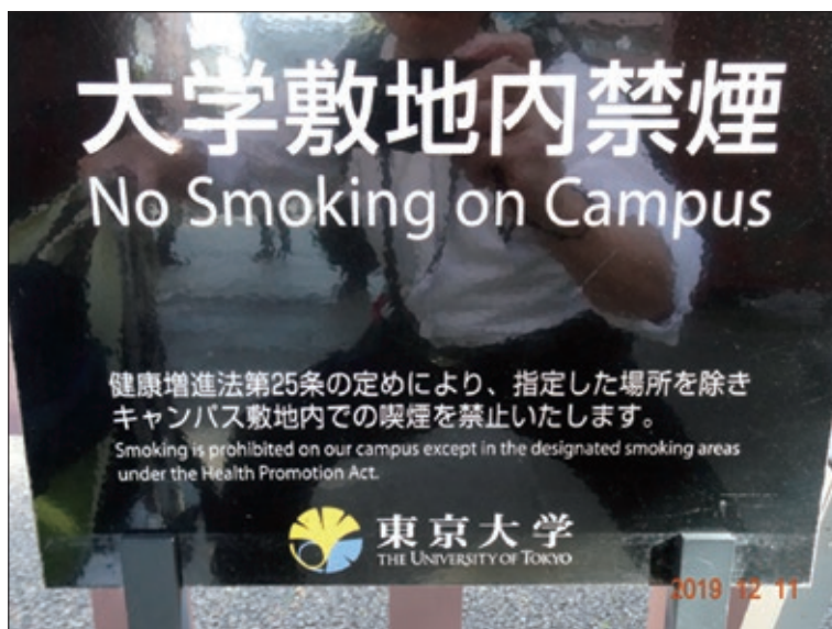
図9. 東京大学赤門、矛盾する「敷地内禁煙」の看板

東京大学は日本人だけでなく外国人にとっても観光スポットになっています。シンポジウムには東京大学の環境安全衛生担当の副学長が参加され