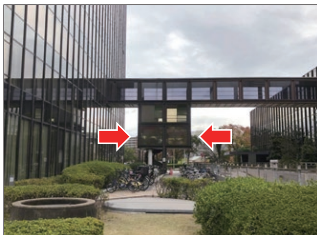
図4. 北九州市役所、渡り廊下2階の喫煙室（2019年11月）

北海道の素晴らしい決定の一方、2019年8月号で紹介したように北九州市は屋外に喫煙室を残しています（図4）。しかも、最近になって外から見えにくくするためのフィルムまで貼られています（きっと税金から支出されていると思います）（図5）。