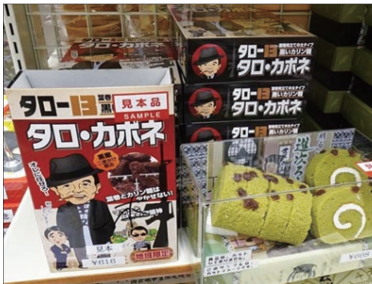
図8. 参議院会館、コンビニの議員グッズ