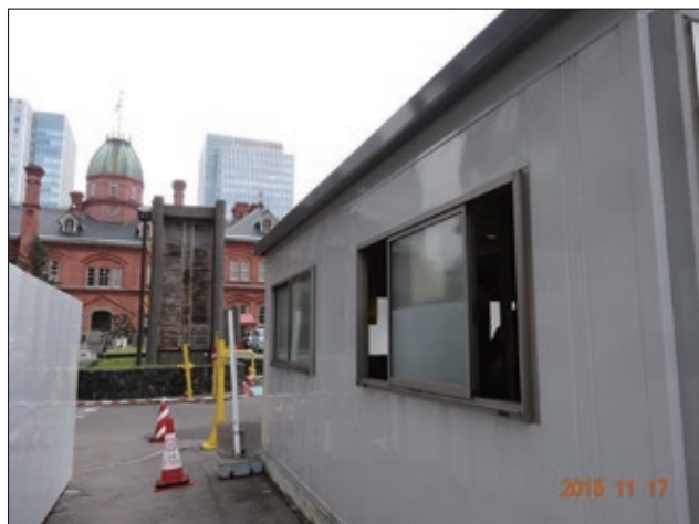
図2. 北海道庁、屋外喫煙室 (2015年)