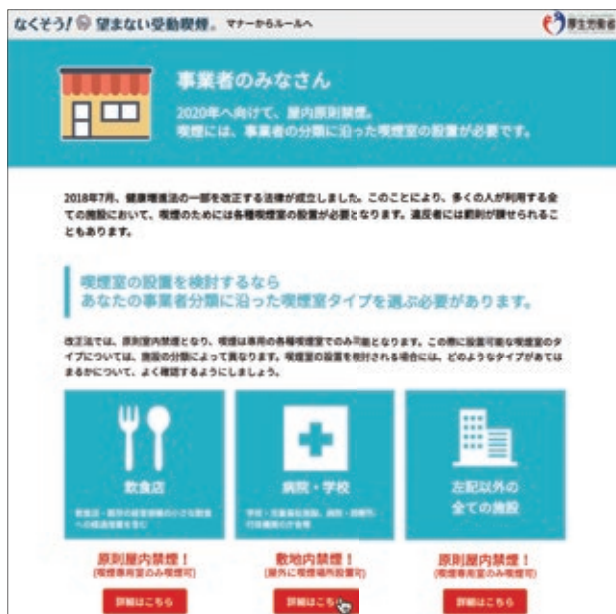
図3. 施設ごとの受動喫煙対策