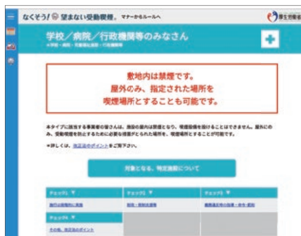
図4. 病院は原則敷地内禁煙