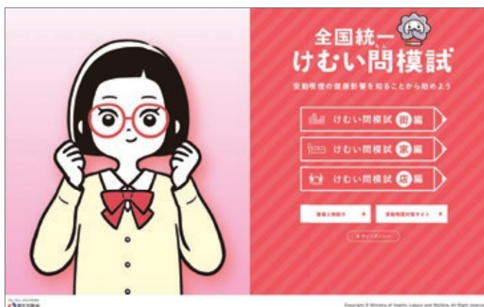
図 6. 「全国統一 けむい問模試」

局長通知 ( 2 月 22 日 ) の「特定屋外喫煙場所を設置することを推奨するものではないことに十分留意すること」の意図を読み取りましょう。同じ 5 月号の「編集室だより」で紹介した単科の精神科である平成病院 ( 八代市 ) のように敷地内全面禁煙をきっぱりと選択して欲しいと思います。敷地内禁煙になれば禁煙治療に医療保険が適用されます。喫煙するすべての患者さんに禁煙治療を提供していきましょう。