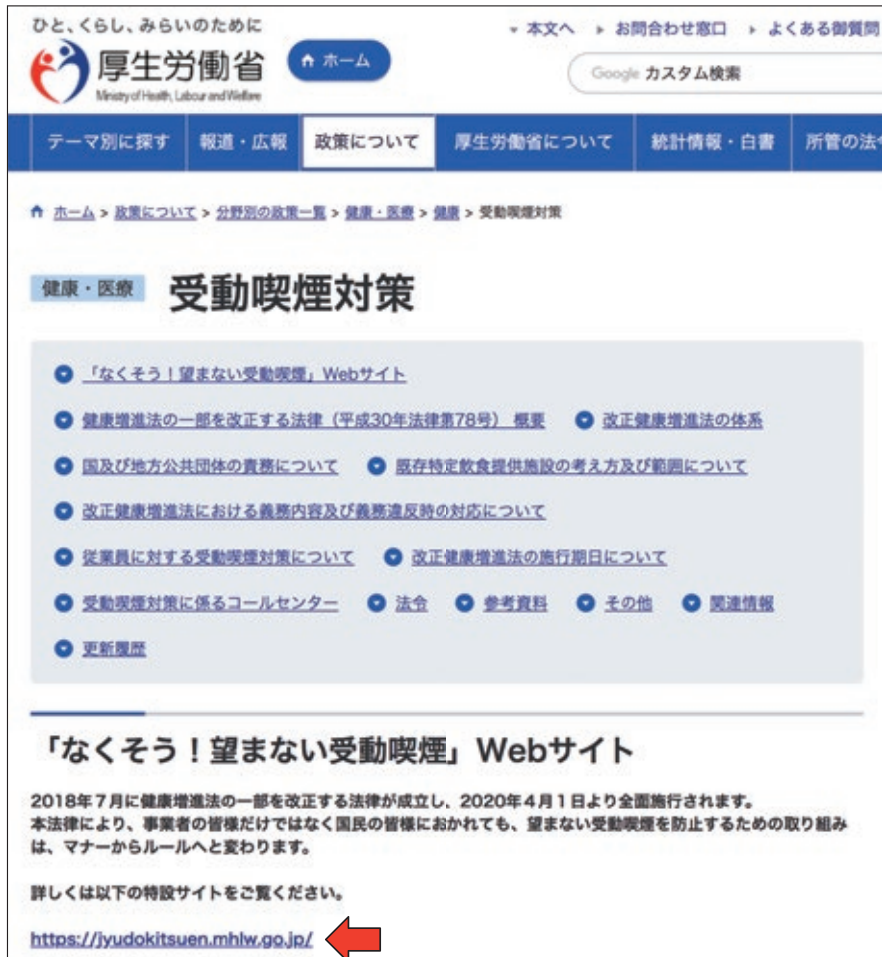
図1. 充実してきた厚生労働省の受動喫煙対策