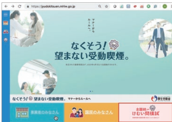
図2. 「なくそう! 望まない受動喫煙」のトップページ

本誌5月号で解説したように第一種施設には「施設を利用する者が通常立ち入らない場所」に特定屋外喫煙場所を設置することが容認されていますが、健康