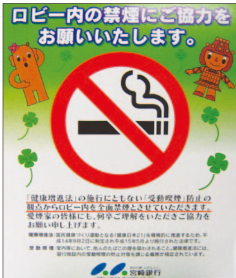
図1. 宮崎銀行の禁煙化を知らせるポスター