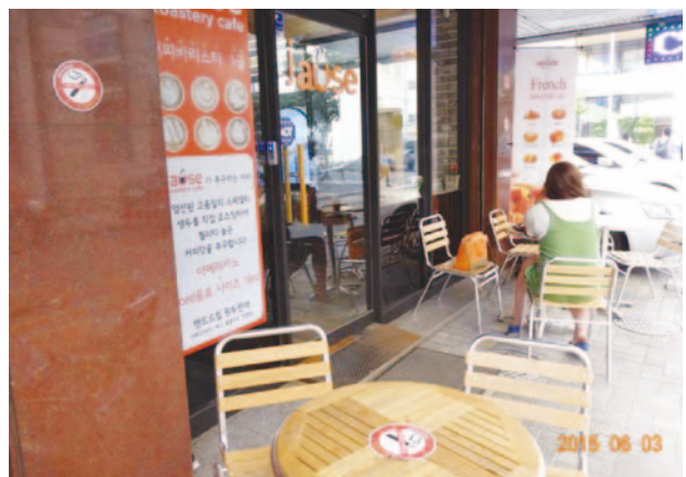
韓国ではテラス席も禁煙