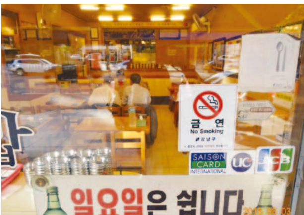
ピョンチャン大会が開催される韓国の飲食店は禁煙