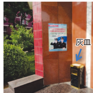
図1.「北京市喫煙規制条例」を周知するポスター

ホテルには「北京市喫煙規制条例」を周知するポスターが貼られておりました(図1、2)。違反者個