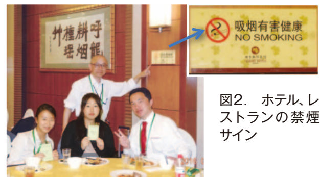
図2. ホテル、レストランの禁煙サイン

人には最高200元(5月のレートで3,400円ですが、北京市の物価から考えると8,000円に相当)、喫煙を容認したレストラン等の事業者は最高1万元(同40万円相当)という罰金が科せられます。違反