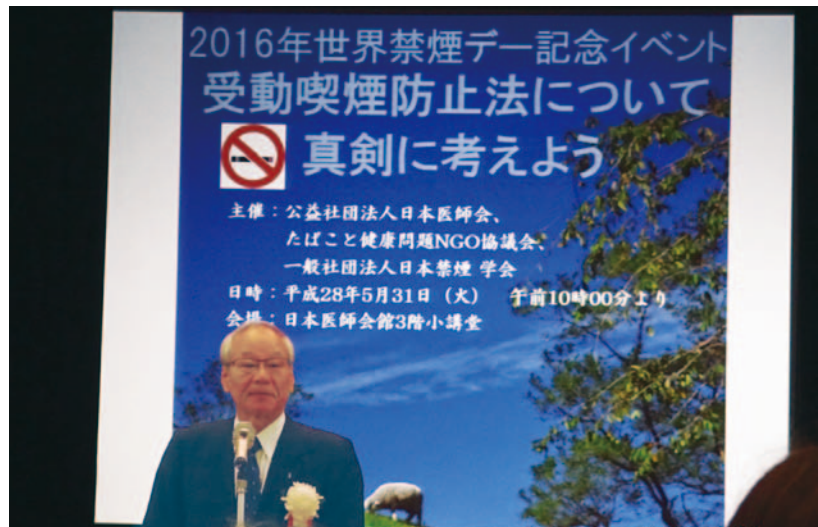
図4. 冒頭の挨拶をされる日本医師会の横倉会長

さて、東京の四師会がこのイベントの後援として名前を連ねておりましたが、条例を成立させる