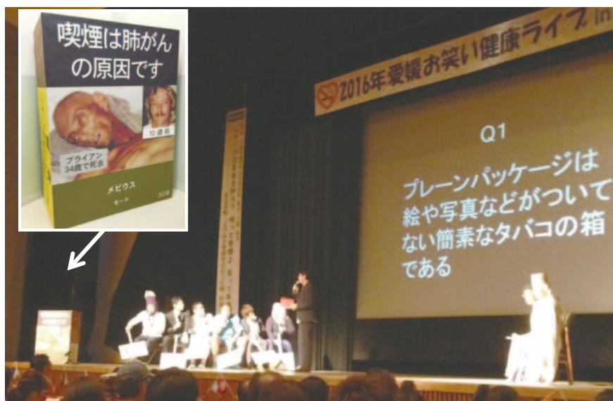
図3. クイズに答える芸人たち（左端はブランドカラーを排除したプレーン・パッケージの巨大模型）

松山市から離れた新居浜市のイベントに愛媛県医師会長の久野悟朗先生と愛媛県副知事が来場・ご挨拶されただけでも凄い、と思ったのですが、代読とはいえ塩崎厚生労働大臣からのご挨拶、白石徹衆議院議員、山本順三参議院議員、井原巧参議院