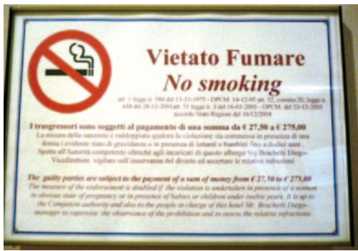
図2 イタリアのレストランに掲示されていた警告表示(2006年)

国民の健康を害する作物を保護するのではなく、タバコ税から補助金を出して海外に輸出できるような付加価値の高い農作物への転作を奨励することが「葉タバコ生産者への配慮」だと思います。正しい政治的判断を下して貰いたいものです。