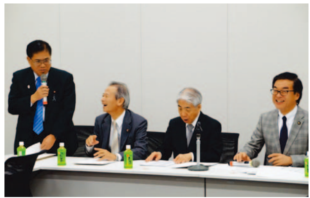
写真1 超党派議連の設立記者会見の様相 (左から榊屋、江田、尾辻、松沢各議員)

2014年11月10日、衆議院第二議員会館第5会議室において「東京オリンピック・パラリンピックに向けて受動喫煙防止法を実現する議員連盟」が発足しました。顧問は江田五月氏(民主)、会長に尾辻秀久氏(自民)、副会長に武見敬三氏(自民)、榊屋敬悟氏(公明)、長妻昭氏(民主)、小池晃氏(共産)、福島瑞穂氏(社民)、そして、幹事長兼事務局長に松沢成文氏(みんな→次世代)など超党派による議連です。偶然、多摩市での講演と同日だったので、終了後に駆けつけたのですが、間に合いませんでした。後日、入手した記者会見の様相を写真1に示します。