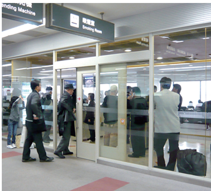
写真2 満員の空港喫煙室

欧米豪のタバコ対策は1990年代から進んでいますが、日本をはじめとしたアジアやアフリカの対策は遅れています。現状を放置すれば、欧米豪で売れなくなったタバコはアジアとアフリカに輸出され、人類全体の健康被害は止まりません。そのこ